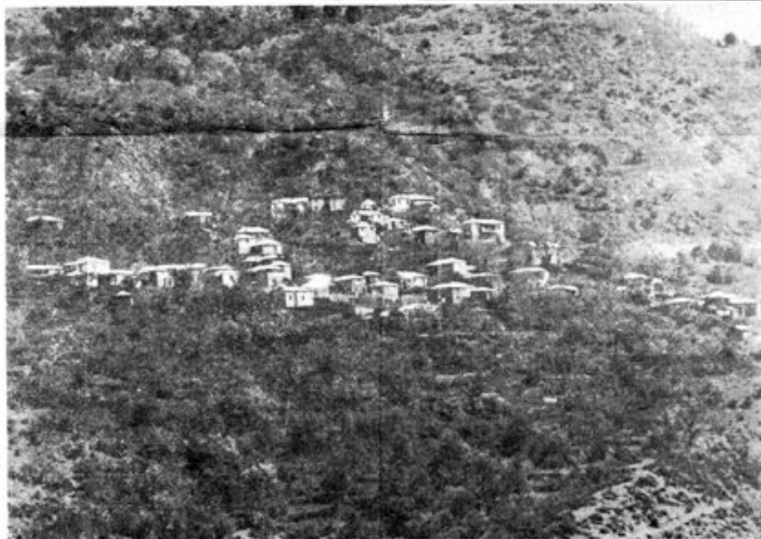
Ἀποψη τῆς Ὀξυᾶς